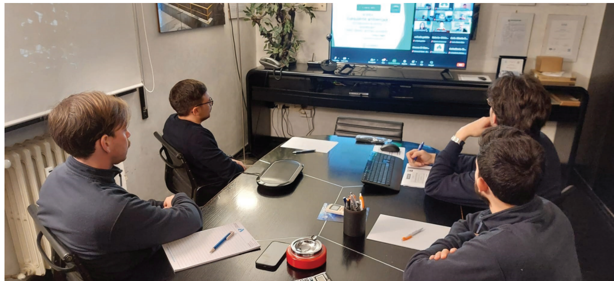
L'AZIENDA BARESE HA RINNOVATO IL PROPRIO TEAM PUNTANDO SUI GIOVANI E SULLA LORO FORMAZIONE

Oggi la volontà dell'impresa è di puntare su prodotti che impattino ancora meno sugli stabilimenti aziendali